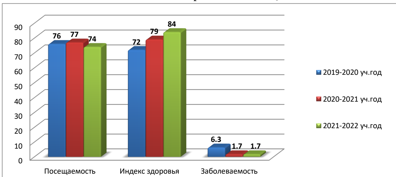
Анализ здоровья воспитанников

Вывод: диагностика физической подготовленности детей, анализ здоровья воспитанников в целом показали, что количество дней , пропущенных одним ребёнком по болезни в год, стабильно не снижается, значительно повысился индекс здоровья , повысилось количество детей с первой группой здоровья.